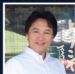
亀岡市長 桂川たかひろ氏