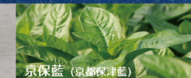
京保藍 (京都保津藍)